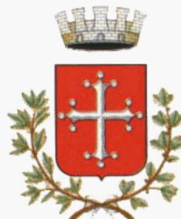
Comune di Pisa